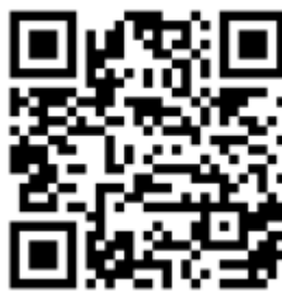
Рисунок 6 — Рекомендации по проведению кинопоказов в профилактике

Среди фильмов по тематике противодействия терроризму можно использовать следующие фильмы: «Беслан. Память» (Россия, 2014 г., возрастное ограничение: 12+), «Кавказский пленник» (Россия, 1996 г., возрастное ограничение: 18+), «Я не террорист» (Узбекистан, 2021 г., возрастное ограничение: 18+), «Отель Мумбаи: противостояние» (США, Австралия, 2018 г., возрастное ограничение: 18+) и т.д.